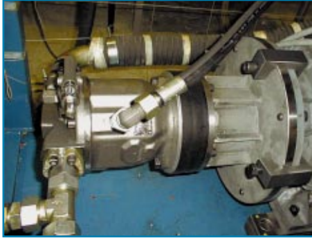
Afbeelding 4. Testaggregaat 2 is uitgerust met speciale flenshouders.