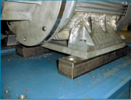
Afbeelding 3. Bij testaggregaat 1 zijn de motoren gemaakt van vol materiaal en aan de motor gelast.