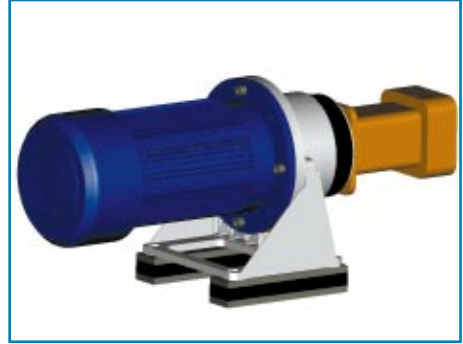
Afbeelding 5. Bij testaggregaat 4 wordt alleen gebruikgemaakt van standaard componenten.

Dit is een belangrijk detail, omdat het geluid vanuit de pomp zich ook via leidingen over verre afstanden kan verspreiden.