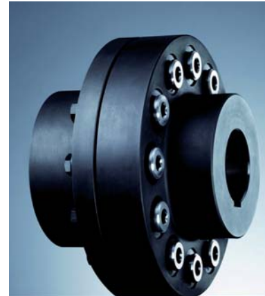
REVOLEX® KX elastische pennenkoppeling

der gevoelig voor koersverschillen tussen diverse valuta. De hoofdvestiging is en blijft Rheine, maar er zijn al productie-faciliteiten in de Verenigde Staten en in China. In India was al sprake van 'customizing' van producten voor de lokale markt. Daar is nu grond aangekocht, wordt de infrastructuur aangelegd en zal regionale productie gaan plaatsvinden voor opkomende economieën als India, Maleisië, Singapore, Thailand, Indonesië en Vietnam. Verder is in 2006 een vestiging geopend in Rusland en ook daar wil KTR over een paar jaar gaan produceren.