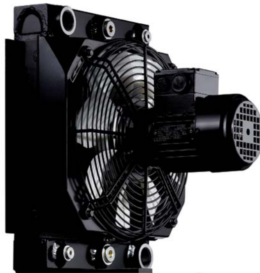
Op de Hannover Messe presenteert KTR het nieuwe programma olie/luchtcoolers