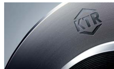
Producten van KTR vormen een belangrijk onderdeel van de totale beweging van een machine

Verder toont het huis uitbreidingen naar boven (qua draaimoment) op de bestaande series POLY-NORM®-koppelingen en de RADEX®-N en RIGIFLEX®-N stalen lamellenkoppelingen